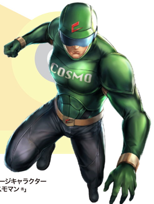
イメージキャラクター 「コスモマン®」

そして現在は、国内初のシステムや多数の特許申請中のロボットシステム、創業から20周年を迎え、AIやビッグデータ、IoTと行った技術を活用した次世代のスマートファクトリー化を実現させるための取組みをコスモ技研では注力しています。今回は、より具体的なコスモ技研の取組みをご紹介します。